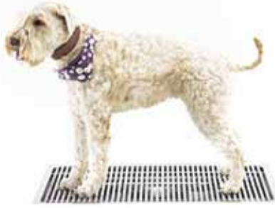
Kurasyöppö Midi 500 x 800 mm