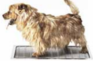
Kurasyöppö Mini 400 x 600 mm