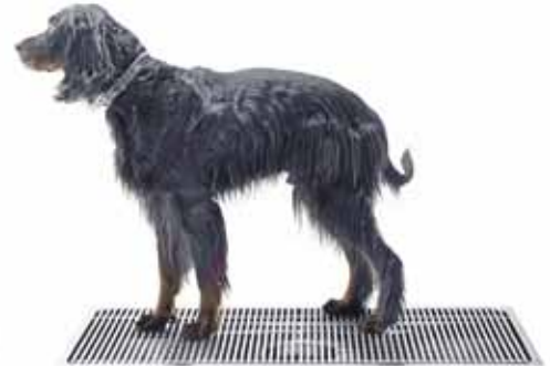
Kurasyöppö Maxi 600 x 1200 mm